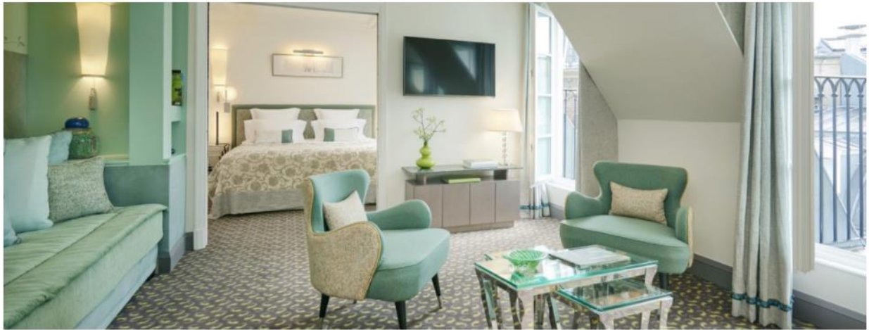
Suite Vendôme